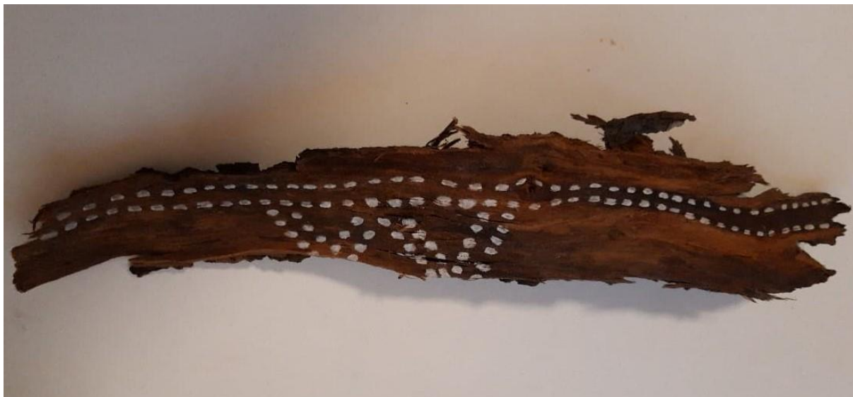
Obr. 2 - Tento kus dřeva jsme s dětmi nejprve pokreslili bílým permanentem, který naznačil to, kde bude dekor a následně jsme ho detailněji domalovali bílou temperou.