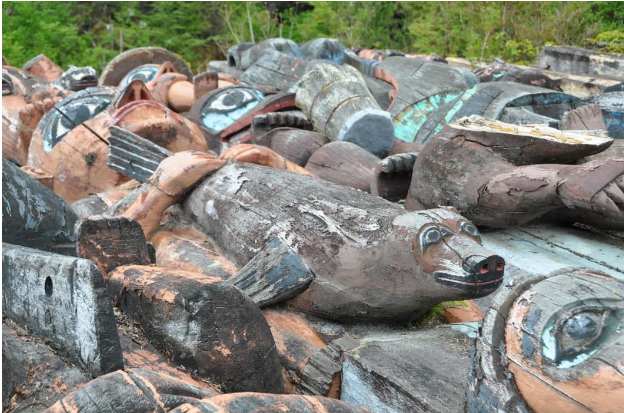
Obr. 5 - Animismus - kdy můžete pomalovat a dotvořit kus dřeva, tak aby se stalo zvířetem, které Vám připomíná☺

animismus (z lat. anima, duše) je víra, která přisuzuje duši živým bytostem, neživým předmětům i místům. Tato duše je nesmrtelná a samostatná duše. Je to jedna z teorií o původu náboženství, která vznikla na konci 19. století a prvním, kdo tuto koncepci sestavil, byl Edward Burnett Tylor.