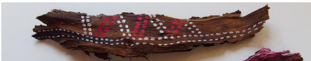
Obr. 3 - Protože se nám nakonec malba bílou barvou zdála málo výrazná, doplnili jsme ji o malbu růžovou akrylovou barvou.

Druhý kus jsme pomalovali, prvně růžovou akrylovou barvou, poté co téměř zaschla, do ní vstoupili bílou barvou, která ze syté růžové barvy, na některých místech vytvořila světlejší růžovou barvu. Motiv malby vždy nějak kopíroval barevné rozdíly ve struktuře dřeviny, její různé tvary a obrazce.