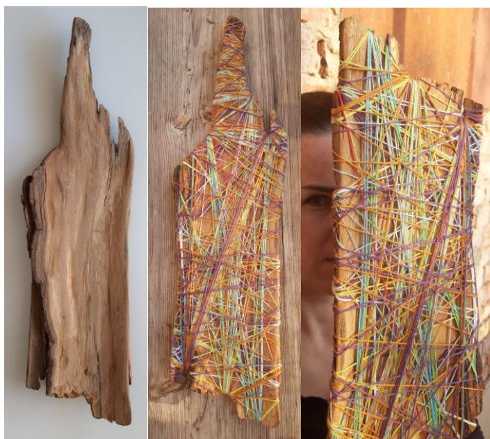
Obr. 5 - 7 - Maska z kůry stromů s dekorem z barevných bavlnek, pro děti 10+

Syn (15) se pro změnu pustil do dvou výrobně složitějších masek. Ta nebyla, až tak výrobně náročná, jako spíš znamenala delší výrobní postup. V tomto případě především šlo o vysušení, tvarové a povrchové vyhlazení vnitřní strany kůry stromu. Zbylé vytvoření dekoru samotným omotáním bavlnkami nebo klubíčky již zvládne každé manuálně šikovnější dítě. První varianta tohoto druhu masky je zcela bez otvoru na oči. Na kůře nikde nebylo místo, kde původně rostla větev - suk.