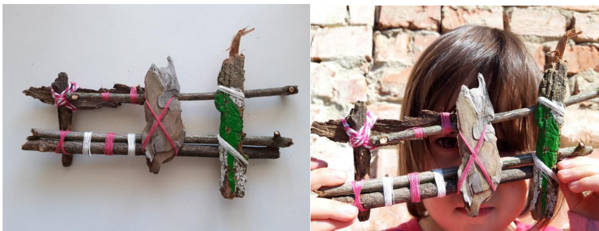
Obr. 3 - 4 - Trpaslík se svojí maskou, pro děti 4+

Syn (15) se pro změnu pustil do dvou výrobně složitějších masek. Ta nebyla, až tak výrobně náročná, jako spíš znamenala delší výrobní postup. V tomto případě především šlo o vysušení, tvarové a povrchové vyhlazení vnitřní strany kůry stromu. Zbylé vytvoření dekoru samotným omotáním bavlnkami nebo klubíčky již zvládne každé manuálně šikovnější dítě. První varianta tohoto druhu masky je zcela bez otvoru na oči. Na kůře nikde nebylo místo, kde původně rostla větev - suk.