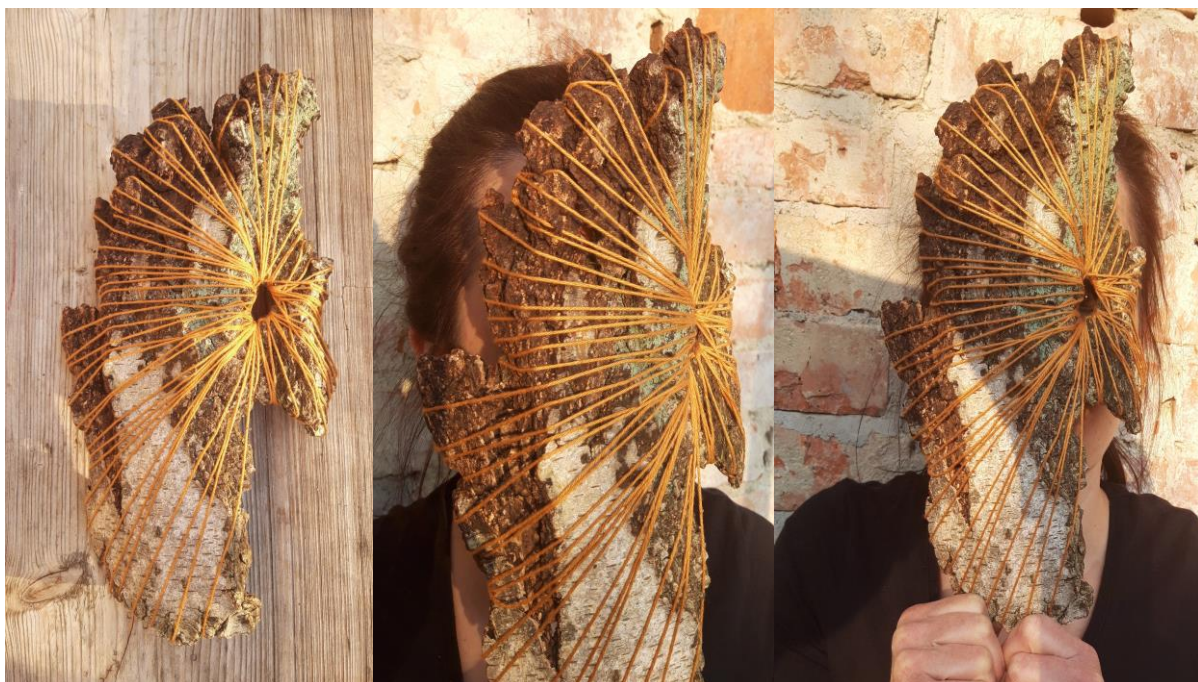
Obr. 8 - Maska z kůry stromů s dekorem směřujícím k jednomu oku, pro děti 10+

Pro děti, které z jakéhokoli důvodu musely zůstat v prostředí domu či bytu, jsme pro zabavení vymyslely dva vzory dle věku dětí (4+ a 10+ let) k pomalování fixy či barvami. (viz. Obr. 9 - 10)