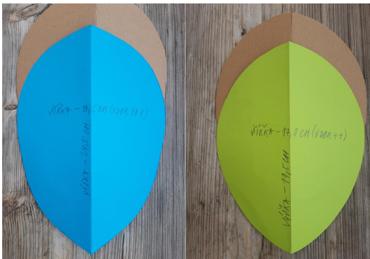
Obr. 9 - 10 - Vzory a šablony kartónové masky pro děti (4+ a 10+ let)

Pro děti, které z jakéhokoli důvodu musely zůstat v prostředí domu či bytu, jsme pro zabavení vymyslely dva vzory dle věku dětí (4+ a 10+ let) k pomalování fixy či barvami. (viz. Obr. 9 - 10)