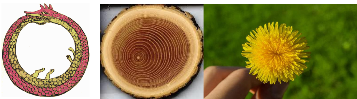
Obr. 2 - Uroboros – symbol cykličnosti, nekonečna