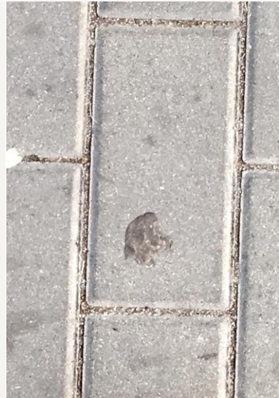
Obr. 2 - Atlas fleků - pán s lasturou (pěna na sklenici piva) - ilustrace vycházející z fleků, autor: Nina Sibinská,