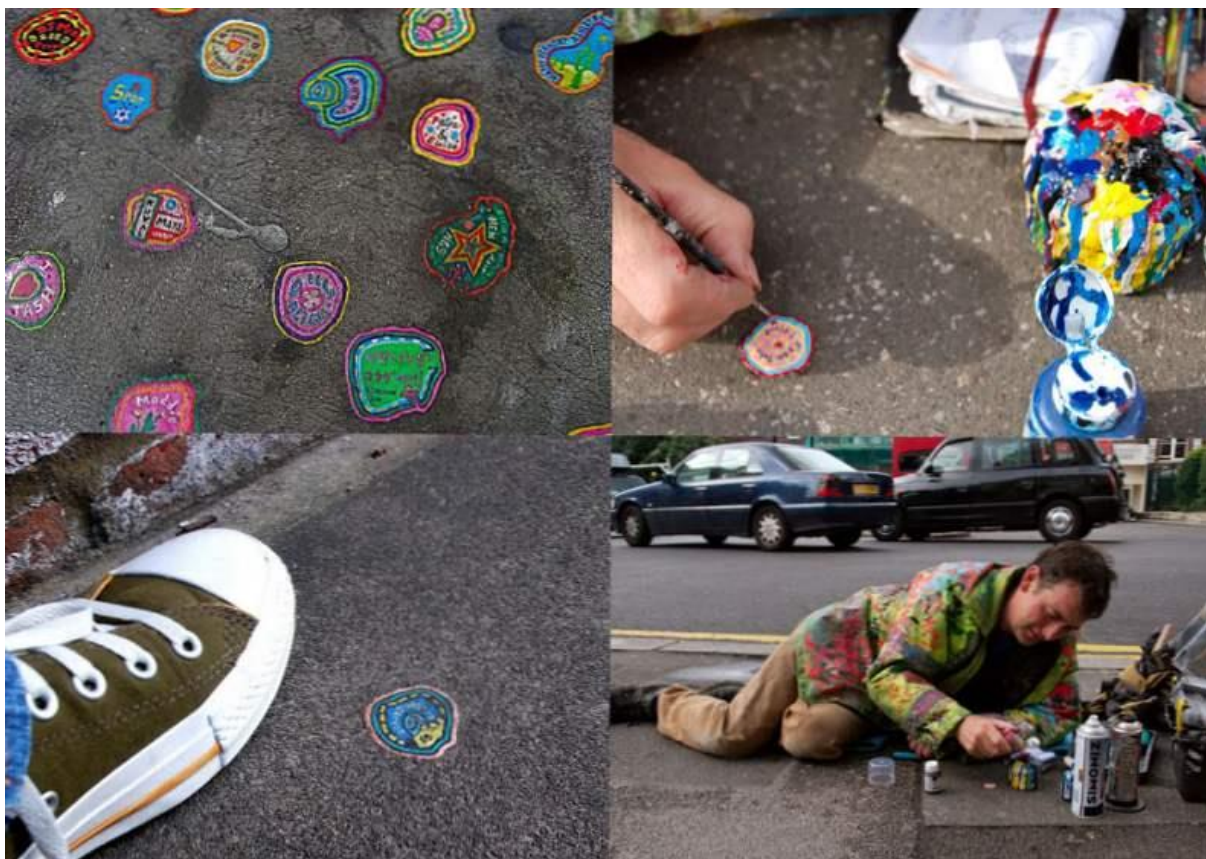
Obr. 4 - Chewing Gum Man - Street Artist – Ben Wilson, dotvářející podobu žvýkačkám na ulici.

Link: https://www.youtube.com/watch?v=Dxrq5p1UmJM